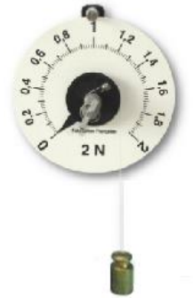
Schéma de l'expérience réalisée :